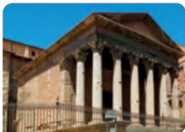
1 Templo romano de Vic, Barcelona.

Los romanos difundieron su idioma, el latín , 2 que sustituyó a las lenguas que se hablaban en la Península antes de la conquista. Solo se mantuvo una lengua prerromana, el euskera.