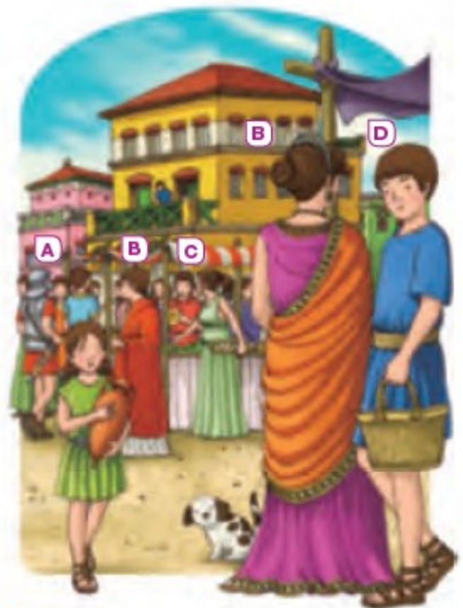
① Los romanos. A. Legionario. B. Patricios. C. Comerciante. D. Esclavo.

Mientras que en el campo existían las villas, en las ciudades había dos tipos de viviendas: las insulae , para los plebeyos; y las domus , para los patricios.