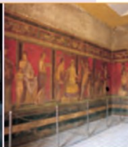
Villa de los Misterios, en Pompeya.