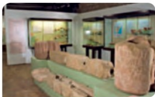
2 Textos romanos en diversas piezas del Museo Najerillense, La Rioja.