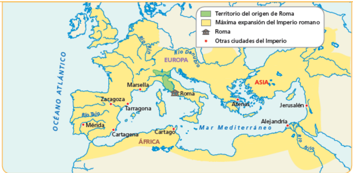
1 Mapa del Imperio romano en su época de máxima expansión.