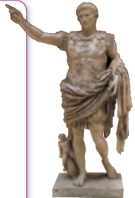
Escultura del emperador Augusto.

La población de Hispania se dividía en y . La mayoría de los habitantes se dedicaba a la agricultura, la o el .