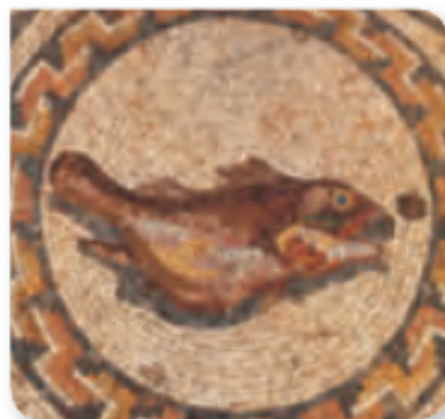
Mosaico romano, Mérida.