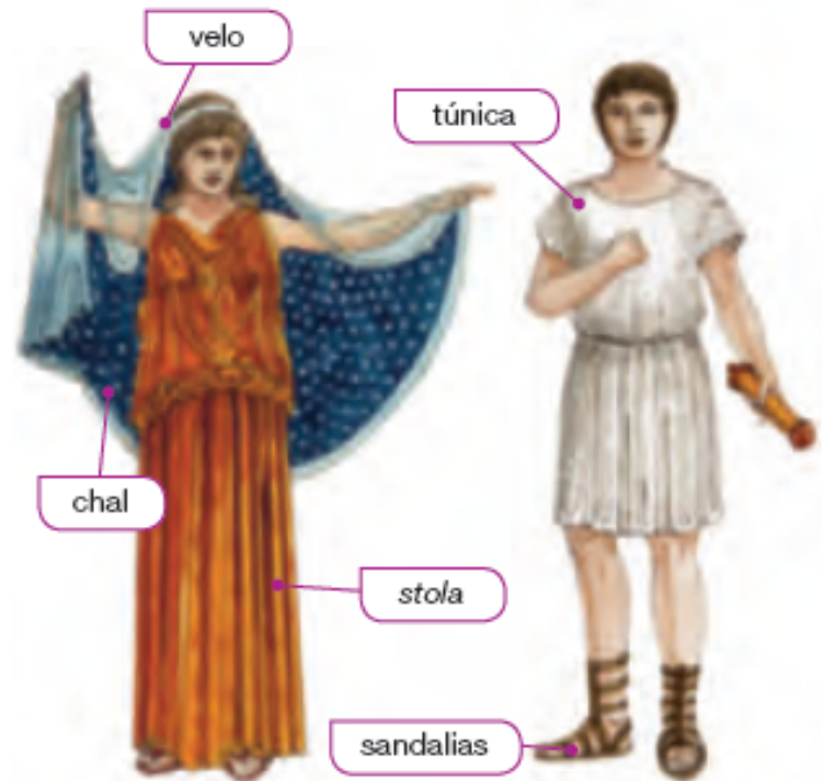
2 El vestido de las mujeres y los hombres romanos.

En Hispania había hombres libres y esclavos. Las domus eran las viviendas de los ricos y las insulae los edificios donde vivían los pobres.