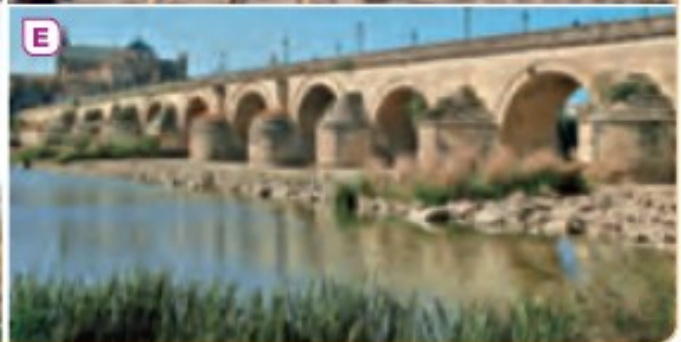
3 Arte hispanorromano. A. Mosaico. Pamplona. B. Teatro de Mérida. C. Acueducto de Segovia. D. Muralla de Lugo. E. Puente de Córdoba.