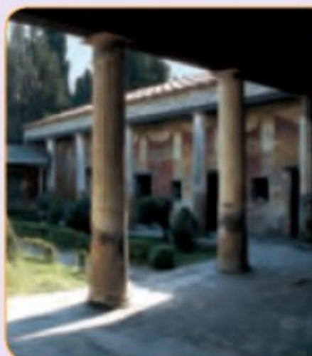
Casa de Venus, en Pompeya.