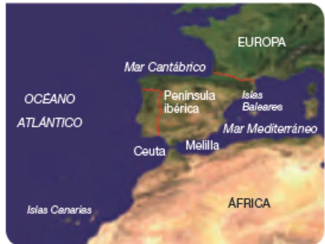
① Los territorios de España.