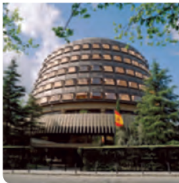
1 Tribunal Constitucional.

España es un Estado democrático. La Constitución es la ley más importante. En ella se recogen las instituciones de gobierno: el jefe del Estado, las Cortes Generales, el Gobierno y los tribunales de justicia.