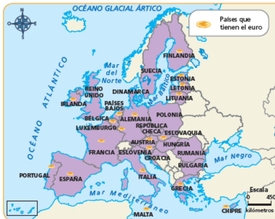
② Los países de la UE.